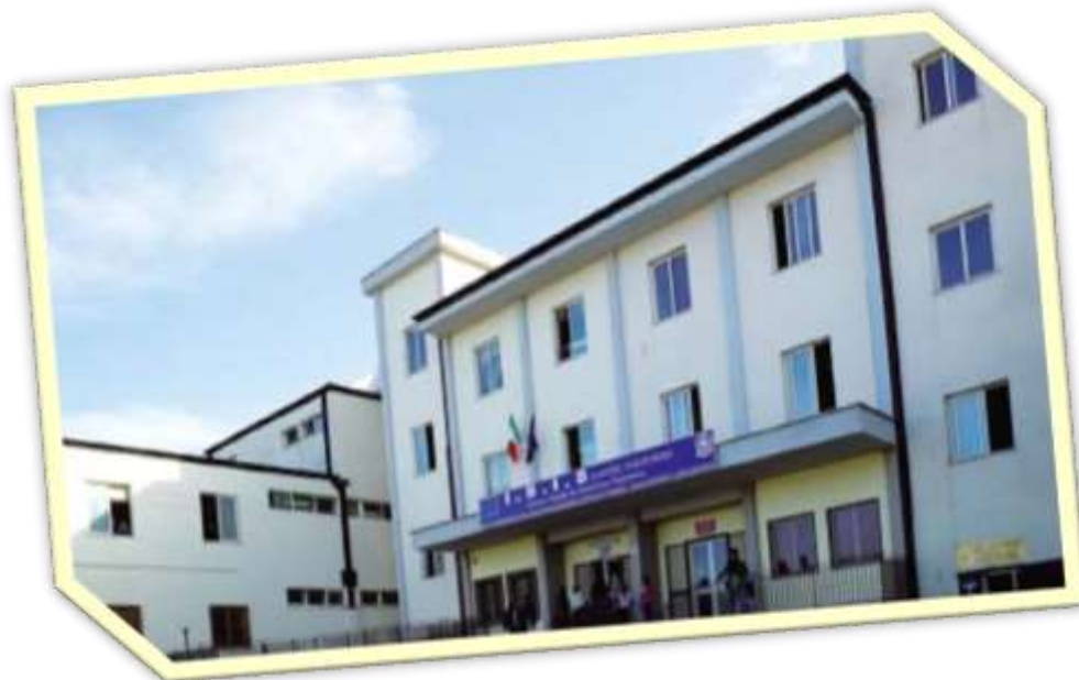
SEDE CENTRALE, VIA MAZZINI, 26

L'istituto si articola in due plessi, uno centrale con sede nel centro storico di Castel Volturno e l'altro a circa 10 km di distanza, nella località di Pinetamare. Ciascuna sede ospita sezioni dei tre diversi indirizzi di scuola.