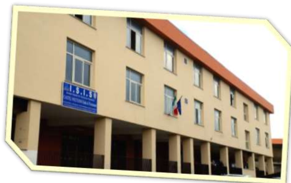
SEDE LOC. PINETAMARE, VIA DELLE ACACIE -